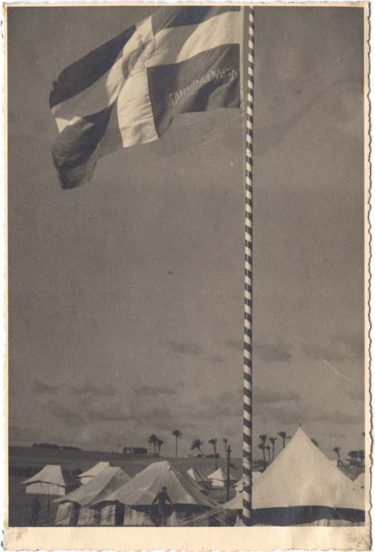
Φωτογραφικό υλικό από το Ελ Αλαμείν του Γενικού Επιτελείου Στρατού