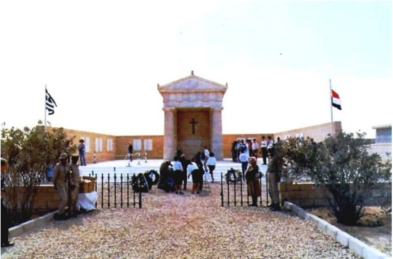
Το μνημείο του αγνώστου στρατιώτη στο Ελ Αλαμείν