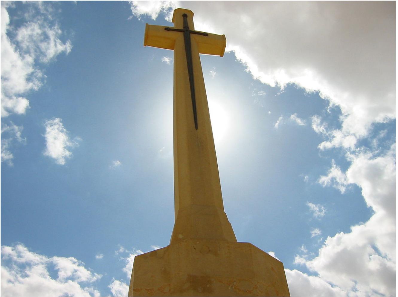
Μνημείο των πεσόντων συμμάχων στο Ελ Αλαμείν