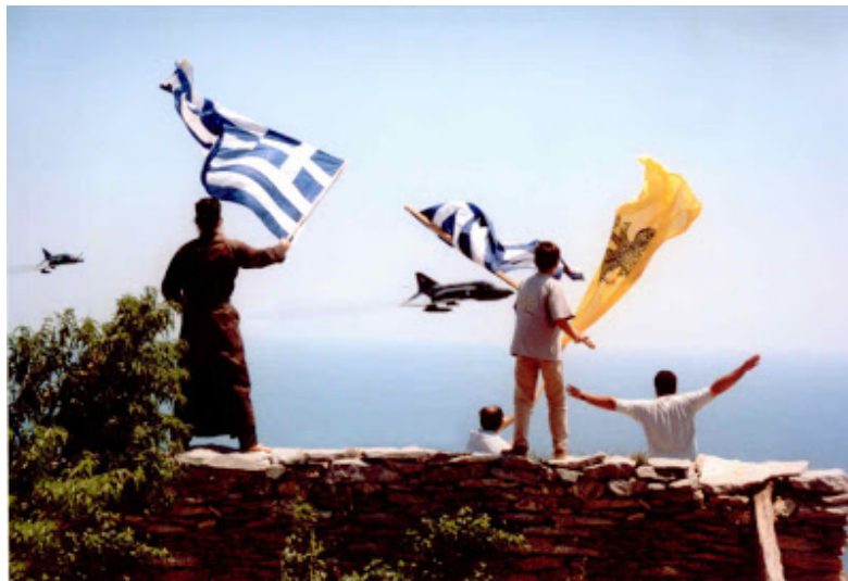
Επιστρέφοντας από αποστολή οι πιλότοι μας πετάν δίπλα από τον άγιο Μηνά στο Αγιο Όρος