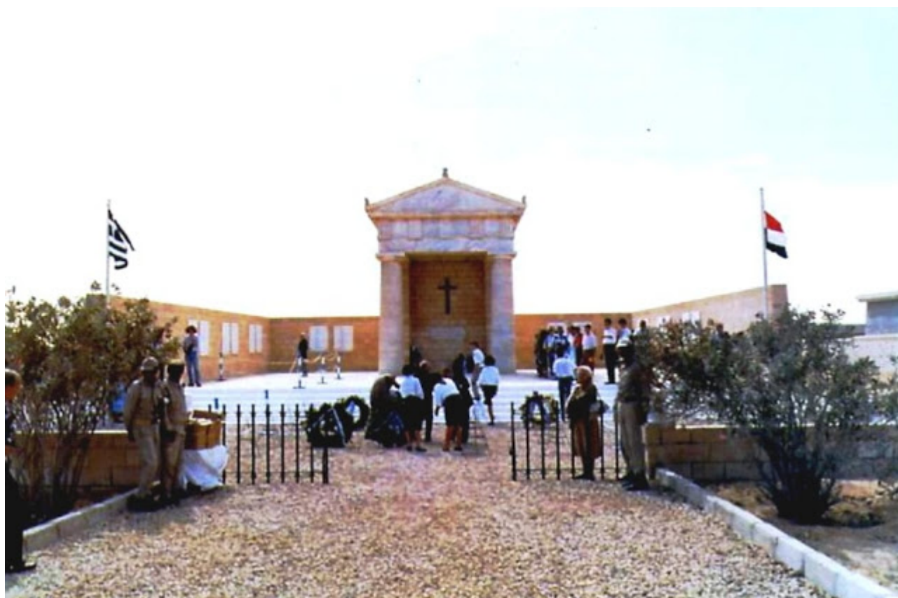
Το μνημείο του αγνώστου στρατιώτη στο Ελ Αλαμείν