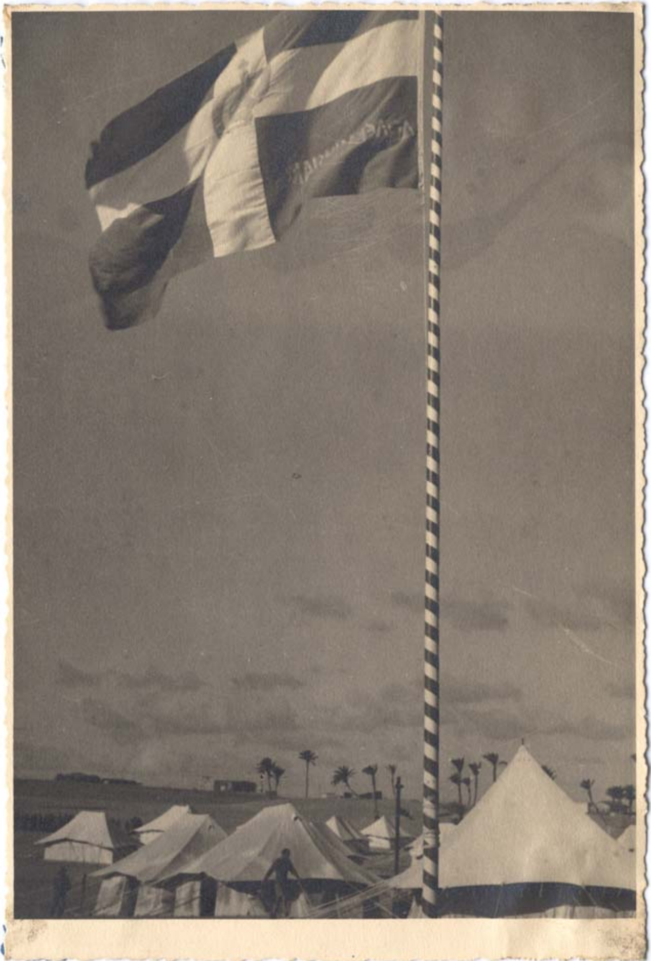
Φωτογραφικό υλικό από το Ελ Αλαμείν του Γενικού Επιτελείου