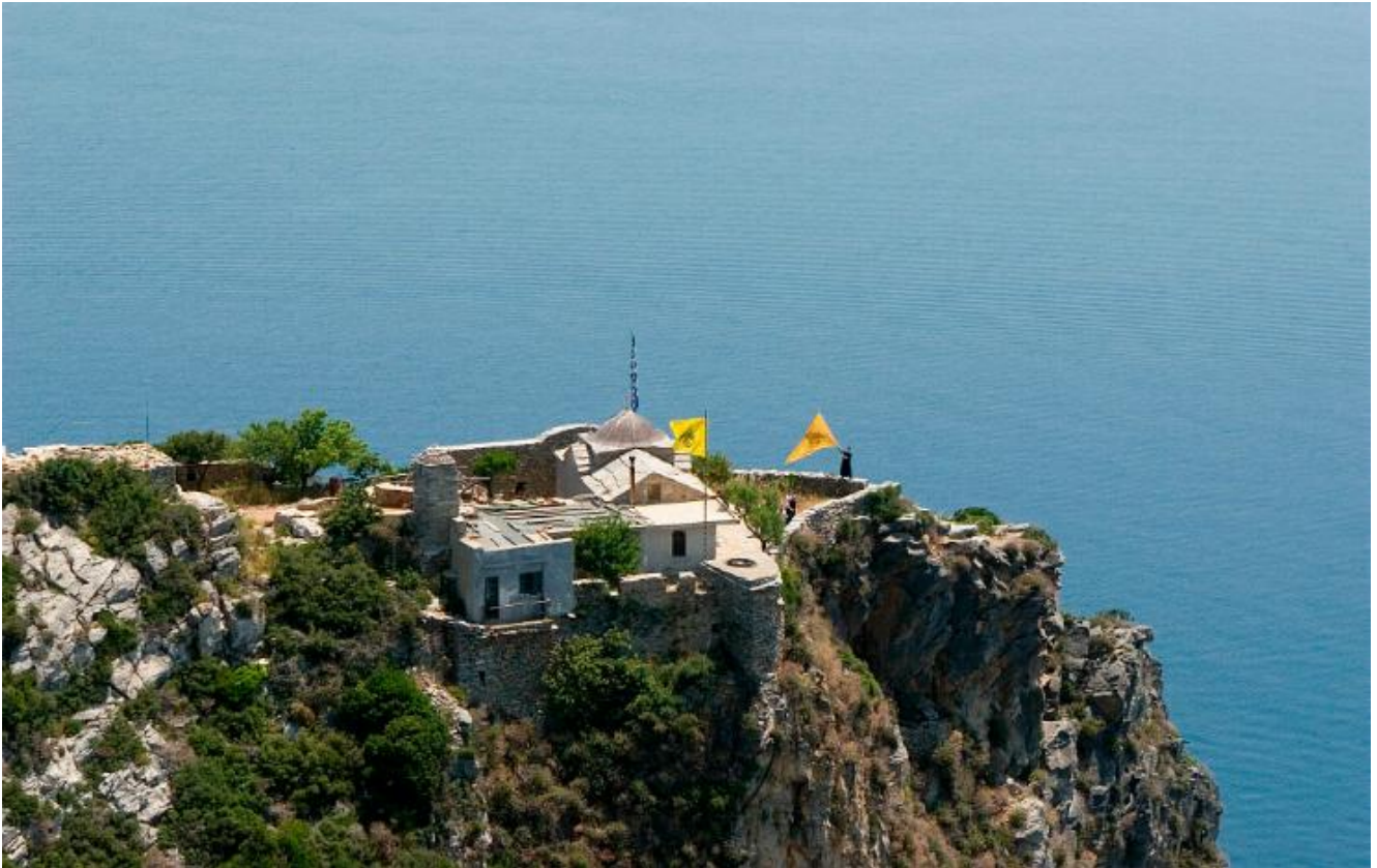
IK Αγίου Μηνά IMM Λαύρας στη Βίγλα του Αγίου Όρους