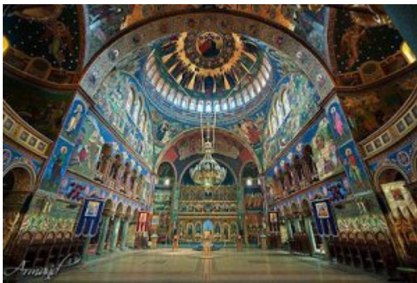
Του Αββά Ιουστίνου Πόποβιτς

Ο ι άγιοι Απόστολοι είναι οι πρώτοι θεάνθρωποι κατά χάριν. Δι' όλης της ζωής των έκαστος εξ αυτών, κατά τον Απόστολον Παύλον, λέγει περί εαυτού: « Ζω δε ουκέτι εγώ, ζη δε εν εμοί Χριστός » (Γαλ. 2, 20). Έκαστος εξ αυτών είναι ο επαναληφθείς Χριστός, ή ακριβέστερον ο παρατεινόμενος Χριστός. Εις αυτούς τα πάντα είναι θεανθρώπινα, διότι τα πάντα είναι εκ του θεανθρώπου. Η αποστολικότητα δεν είναι άλλο τι παρά ο θεάνθρωπος Χριστός εκουσίως οικειοποιηθείς διά της αγίας ασκήσεως των θείων αρετών: της πίστεως, της αγάπης, της ελπίδος, της προσευχής, της νηστείας, και των λοιπών αγίων αρετών. Τούτο δε σημαίνει ότι παν το ανθρώπινον εις αυτούς ζη εκουσίως διά του θεανθρώπου, σκέπτεται διά του θεανθρώπου, αισθάνεται, θέλει και ενεργεί διά του θεανθρώπου. Διά τους αγίους Αποστόλους ο ιστορικός Ιησούς Χριστός ο θεάνθρωπος, τον Οποίον αυτοί κηρύττουν, είναι η υψηύστη αξία και το έσχατον παν-κριτήριο. Ό,τι έχουν μέσα τους και ό,τι πράττουν ή κηρύττουν ή παραδίδουν είναι από τον θεάνθρωπον, εν τω θεανθρώπω και διά τον θεάνθρωπον.