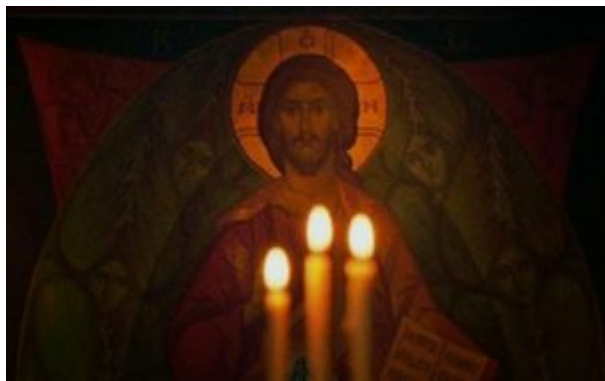
Άγίου Μακαρίου τοῦ Αἰγυπτίου

Με τη χάρη και τη θεία δωρεά του Πνεύματος ο καθένας από μας κερδίζει τη σωτηρία· με πίστη πάλι και αγάπη και με αγώνα της αυτεξούσιας προαιρέσεως μπορεί να φτάσει στο τέλειο μέτρο της αρετής. Και τούτο, για να κληρονομήσει την αιώνια ζωή όχι μόνο με τη χάρη, αλλά και με τη δικαιοσύνη.