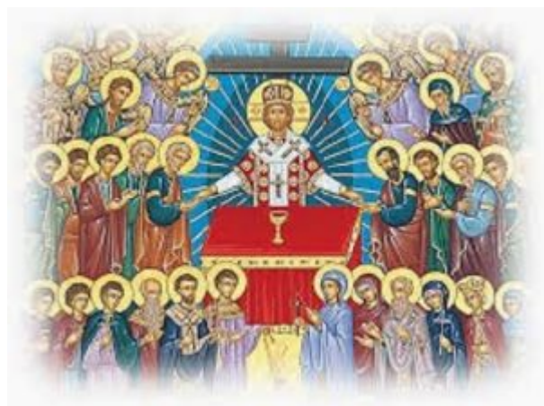
π. Αλέξανδρος Σμέμαν

Γιατί πιστεύω; Κοιτάζω μέσα μου, μέσα στις εμπειρίες και στα αισθήματα μου και μολοταύτα δεν βρίσκω καμία απάντηση. Τι σημαίνει ο θεός για μένα; Ένας τρόπος να ερμηνεύσω τον κόσμο και τη ζωή; ΟΧΙ!