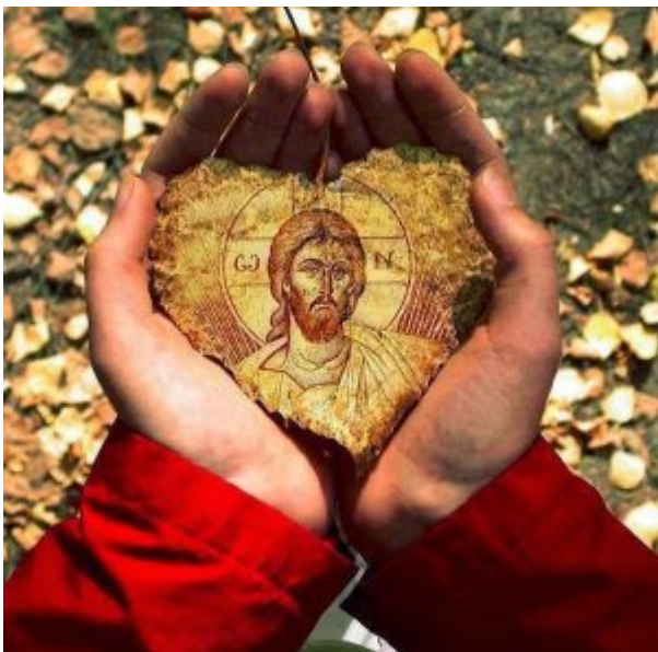
Άγιος Μακάριος ο Αιγύπτιος.

Οί ψυχές ποῦ ἀγαποῦν τὸν θεὸ καὶ τὴν ἀλήθεια, δὲν ὑποφέρουν οὔτε τὴν παραμικρὴ ἐλάττωση τοῦ ἔρωτά τους πρὸς τὸν Κύριο. Ἀλλὰ καρφωμένες ὀλοκληρωτικὰ στὸ σταυρὸ Του αἰσθάνονται μέσα τους τὴν Πνευματικὴ προκοπὴ. Πληγωμένες λοιπὸν ἀπὸ τὸν πόθο Του, κι ἂν ἀκόμη ἀξιωθοῦν θεῖα μυστήρια καὶ μετὰσχουν εὐφροσύνης καὶ Χάριτος, δὲν ἔχουν πεποίθηση στὸν ἑαυτὸ τους, οὔτε νομίζουν ὅτι εἶναι τίποτε. Ἀλλὰ ὅσο ἀξιώνονται πνευματικὰ χαρίσματα τόσο ἐπιζητοῦν τὰ οὐράνια. Καὶ ὅσο περισσότερη προκοπὴ αἰσθάνονται, τόσο πιὸ λαίμαργες γίνονται γιὰ τὰ θεῖα. Καὶ ἐνῶ εἶναι πνευματικὰ πλούσιες, κάνουν σὰν νὰ εἶναι φτωχές. «Ὅσοι μὲ τρῶνε θὰ πεινάσουν κι' ἄλλο, καὶ ὅσοι μὲ πίνουν θὰ διψάσουν κι' ἄλλο», λέει ἡ θεῖα Γραφή.