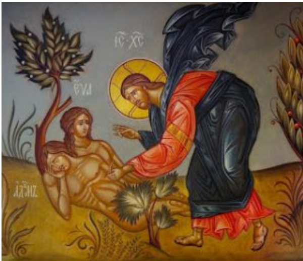
Η «ΜΙΤΟΧΟΝΔΡΙΑΚΗ ΕΥΑ»